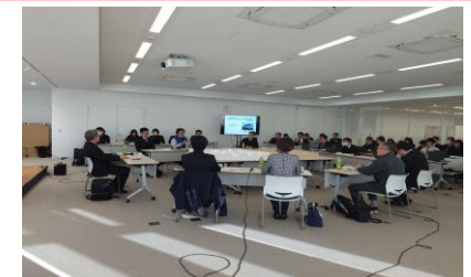
第5回の会議の様子