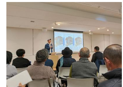
リノベーションまちづくり講演会