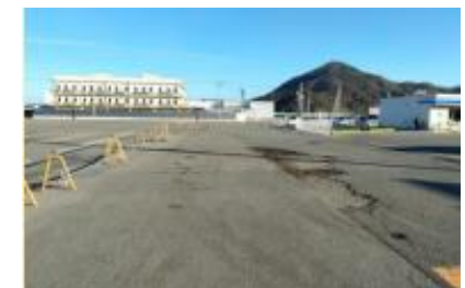
ボートレース西側敷地