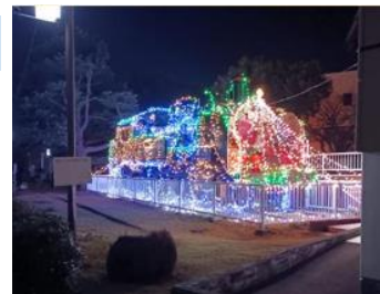
汽車公園イルミネーション