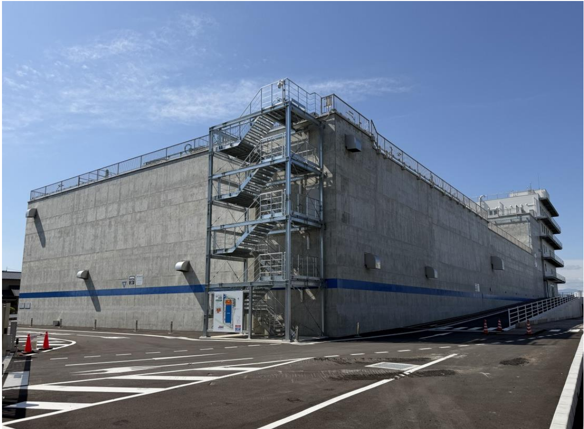
鳴門市・北島町共同浄水場

水質検査計画は、水質基準に適合し安全であることを保障するために不可欠であり、水道水の水質管理において核をなすものです。